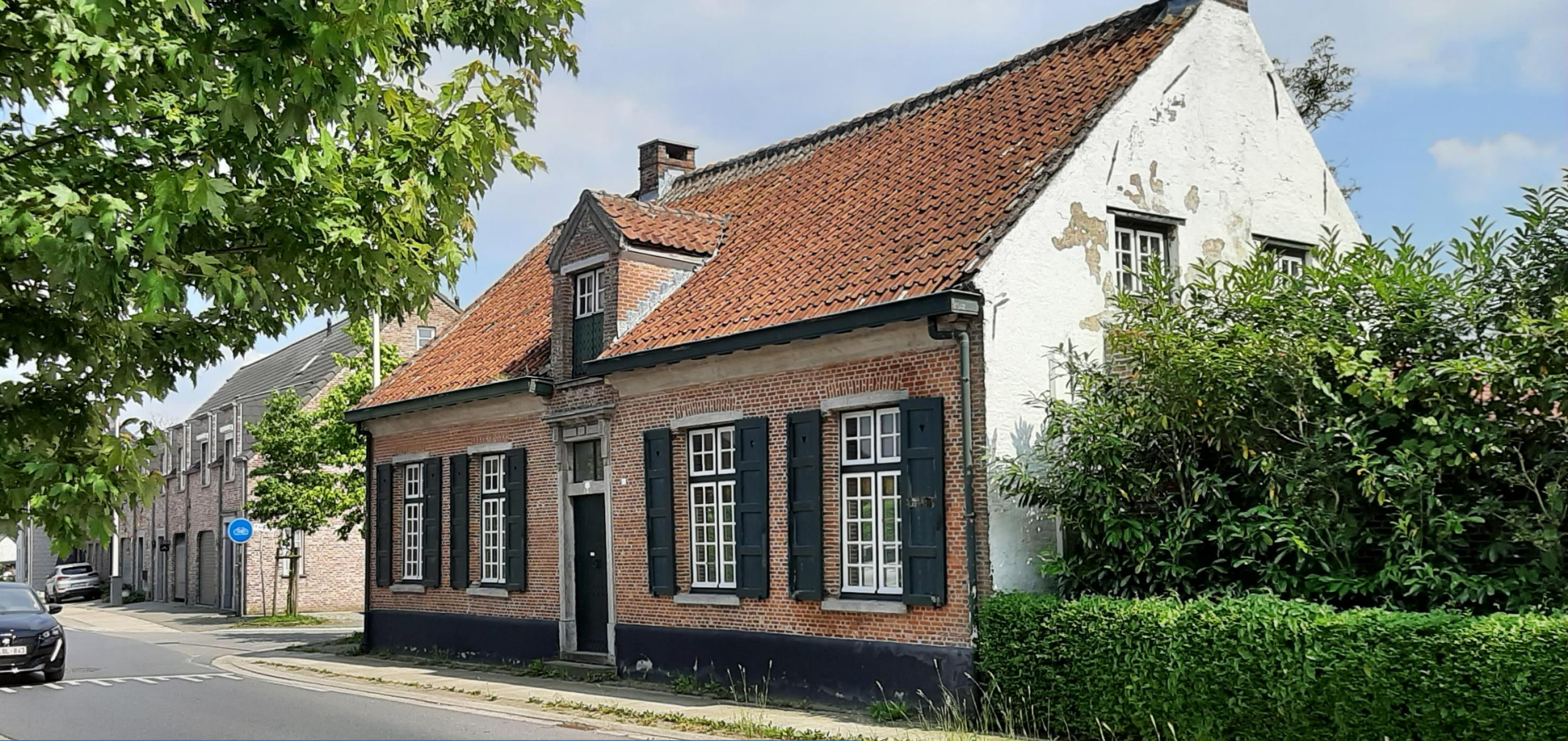
'den Es' gedateerd 1812. Den Es is één van de oudste gehuchten van historische gelegen aan de oude heirbaan. Den Es was vroeger een bestond al in de 5 e eeuw. Een herberg den ouden Es bestond in 1631.