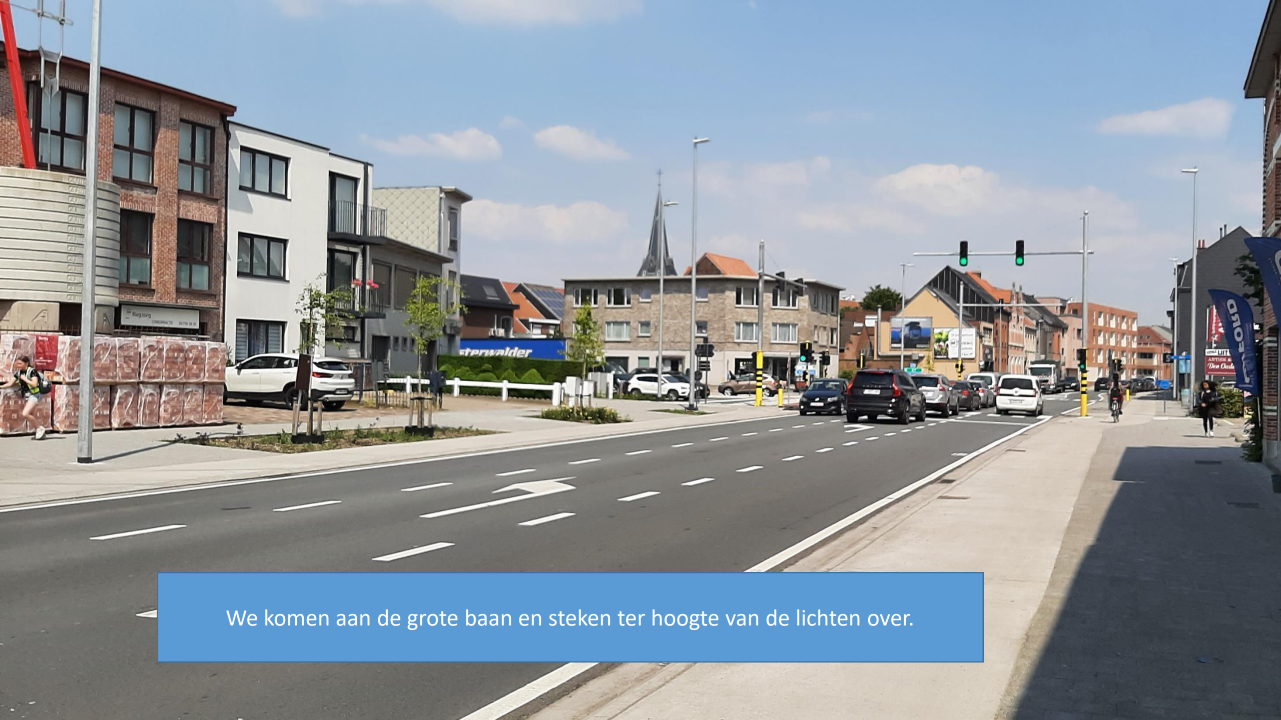
We komen aan de grote baan en steken ter hoogte van de lichten over.